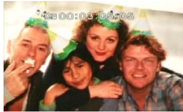
Das ist meine Familie.