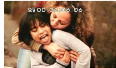
Meine Mutter kuschelt gerne.