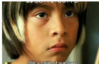
Das Bild offenbart die Traurigkeit und Enttäuschung des Jungen, als er mit anhört, wie sehr sich seine Eltern auf ihr "eigenes" Kind freuen.