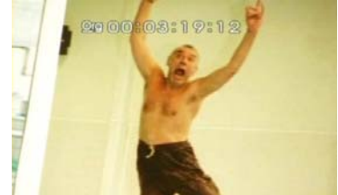
Genau wie mein Opa Douwe. Papa und Opa sind echte Steggerdas.”

Koos stellt seine Familie vor, indem er die einzelnen Mitglieder und deren Eigenschaften beschreibt. Mittels Off-Stimme erfahren die ZuschauerInnen Koos' Gedanken, während er die Fotos seiner Lieben in ein Album klebt. Zwischen den Familienbildern wird immer wieder das Gesicht des Jungen beim Betrachten der Fotos gezeigt. Das Publikum sieht also die selben Bilder wie Koos, hört dessen Kommentar über und erlebt seine emotionale Reaktion auf die Bilder – so, als ob man sich gemeinsam mit einem Freund ein Fotoalbum ansieht. Durch die vielen Nahaufnahmen vom Gesicht des Jungen bekommen die ZuschauerInnen einen direkten wie intimen Einblick in dessen Gefühlswelt.